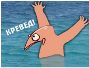
Кревед или всё-таки Медведко?

распространённых, но на самом деле паразитом может оказаться всё что угодно. Взять, к примеру, садистские стишки — их складывали все, кому не лень, и задолго до появления этих ваших интернетов.