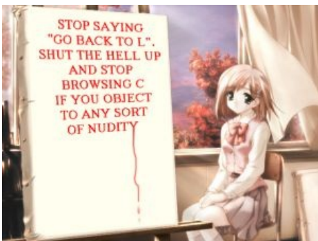
Зарубежные мемы: gb2 , STFU и Sort of

Места зарождения мемов — это различные сообщества и прочие интернет-свалки ( жежешки , форумы , ютубы , имиджборды ), где полно народу, легко поддающегося захвату мозга. Мемы бывают разной степени локальности, в зависимости от того, какую часть интернета покрывают, для всех же остальных они абсолютно безвредны, поскольку совершенно непонятны и несмешны. Первоисточником мема может быть что угодно: горячая новость в СМИ ( иранские ракеты ), фраза отдельной личности в ЖЖ ( чуть более, чем наполовину ), предмет искусства ( Джоконда ), персонажи аниме и так далее до бесконечности.